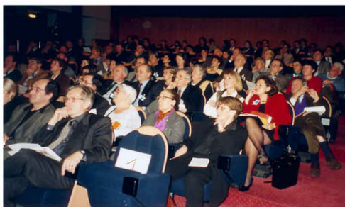
Le public assistant aux auditions avant le vote.

Les fiches des Actions sont présentées sur le site internet du Séminaire : www.arturbain.fr